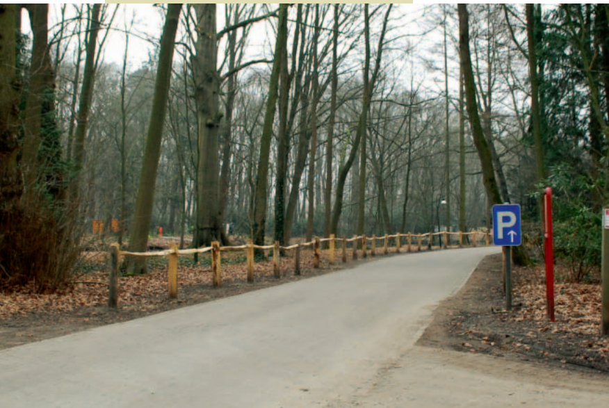
1: houten afsluitingen