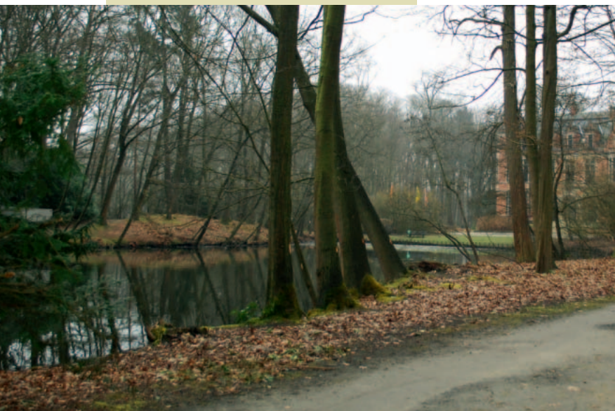
2: meer zonlicht voor de vijver