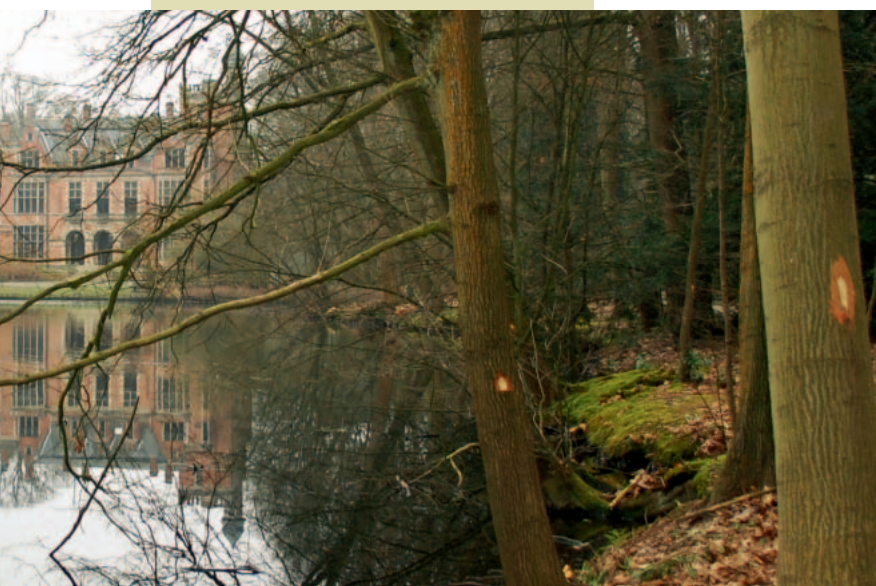
3: merkteken voor boomkappingen

Aan de hand van de plannen hiernaast vertellen we u graag nog iets meer over de werken die de komende maanden en jaren stelselmatig zullen uitgevoerd worden.