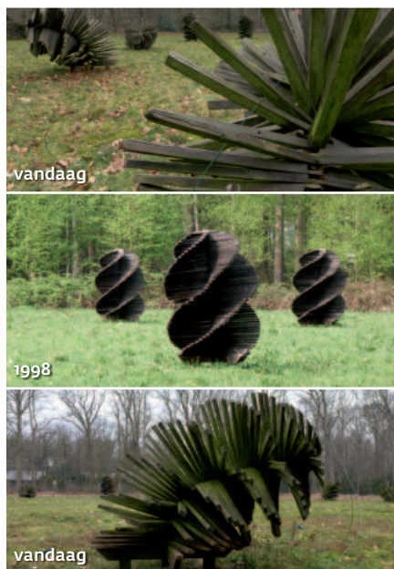
De natuurlijke processen hebben hun sporen achtergelaten op het kunstwerk 'They Wish' in het park van Halle.

"Ik werk met ritmische vormen, meestal in natuurlijk kleuren, en dikwijls in serie opgesteld", legt hij uit. "Dan denk ik aan de lijnen, hoopjes en stapels die het gevolg zijn van de ritmische arbeid van boeren en landarbeiders: hooien, bemesten, ploegen ... Al deze activiteiten resulteren, zelfs als de arbeid door machines gebeurt, in repetitieve lijnen, voren, hoopjes, oppers ... en dit steeds in menselijke maat en - belangrijk - in harmonie met de omgeving."