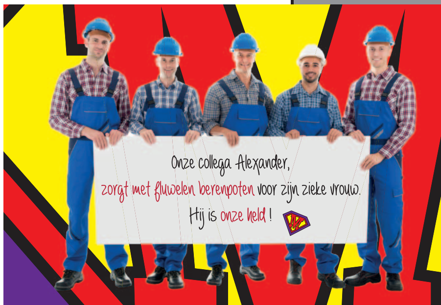
U verdient een dikke dankuwel voor al uw goede en warme zorgen, en alles wat u - soms te vanzelfsprekend - voor een ander doet.

Op 23 juni 2018, op de Vlaamse Dag van de Mantelzorg, gaat een tweede fase van de website online en wordt er een portaal voor professionelen toegevoegd. Zij vin-