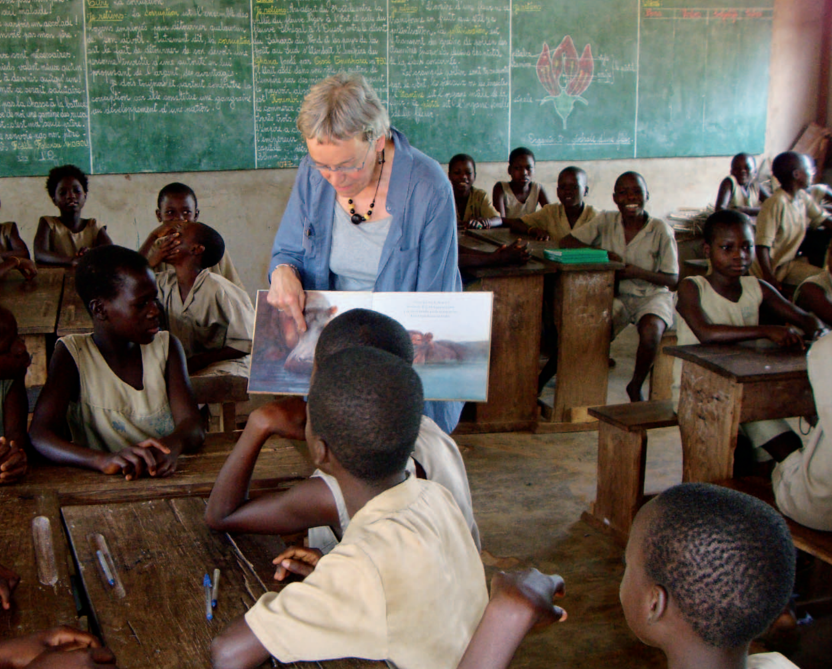
boeken helpen bij de ontwikkeling van kinderen

koppelen en konden we een kabel naar het andere gebouw trekken.