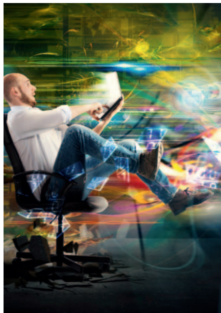
Raadpleeg vanaf nu bij de FOD Binnenlandse Zaken uw eigen digitale dossier.

De federale politie roept u hierbij op om minstens uw gsmnummer en e-mailadres in te geven, zodat overheids- en politiediensten u snel kunnen contacteren wanneer het nodig is. Deze vraag kadert trouwens ook in de strijd tegen identi-