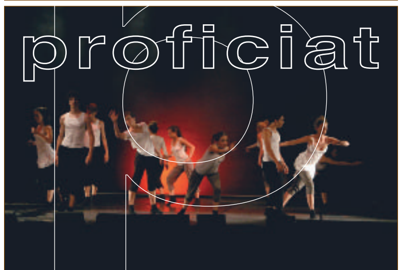
Danscompagnie Vigelandt, die deel uitmaakt van de Zoerselse ballet- en dansschool NIKé, behaalde begin juli op het Internationaal Dansfestival in Praag de eerste prijs in de categorie 'danstheater'.

Om met de fiets te rijden, moet u natuurlijk eerst een tweewieler hebben. In de actie tegen fietsdiefstallen komen er ook bij evenementen van verenigingen beveiligde fietsenstallingen, zodat de fietsen bij hun rechtmatige eigenaars blijven. Anders heeft u niks aan gezien worden, dan bént u gewoon gezien. Maar da's dan weer wat anders.