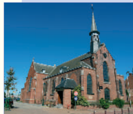
De meest ingrijpende restauratiewerken hebben buiten plaatsgevonden. Het vermolmd dakgebinte van de kerk was de aanleiding voor de werken. Het dak, de leien, de zolder, de bliksembeveiliging... ze kregen allemaal een beurt