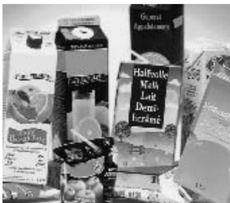
Brik (drankkartons) is heel giftig als u het bij te lage temperaturen verbrandt.