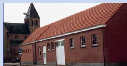
De nieuwe zaal De Bijl na de renovatie. Op de voorgrond de vroegere feestzaal uit 1933.