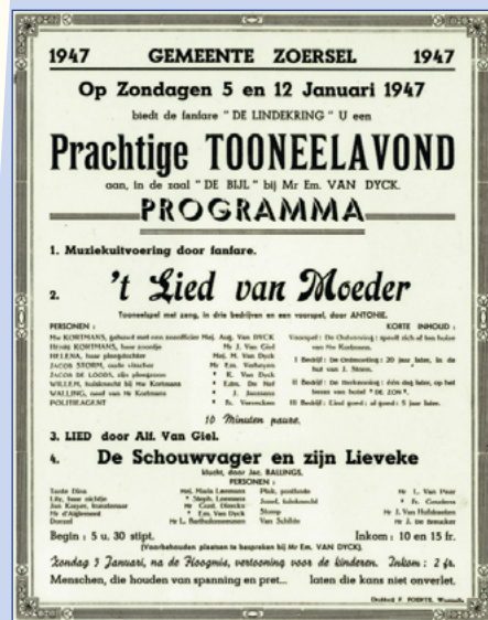
Een toneelopvoering van De Lindekring.

De Bijl werd genoemd naar het bijlvormige perceel waarop de herberg stond. Bijl en bijlstuk komen vaak voor als benaming voor percelen die bijlvormig zijn, namelijk langwerpige stukken met vierkante uitsprong op één van de einden. Voorbeelden hiervan zijn Bijl, Bijlakker, Bijlkamp.