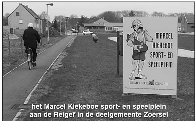
het Marcel Kiekeboe sport- en speelplein aan de Reiger in de deelgemeente Zoersel

Grondige opmetingen en berekeningen moeten uitwijzen of deze papieren oplossingen realiseerbaar zijn. Hoewel de effectieve uitvoering van de bovengenoemde maatregelen nog niet voor morgen zijn, hoopt het gemeentebestuur dat hiermee toch definitieve oplossingen in zicht zijn.