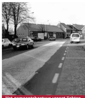
Het gemeentebestuur vraagt lichten