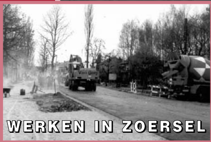
WERKEN IN ZOERSEL