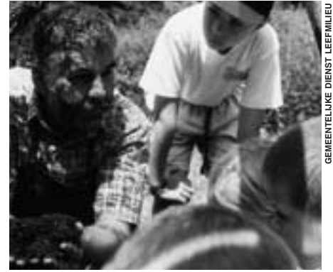
GEMEENTELIJKE DIENST LEEFMILIEU