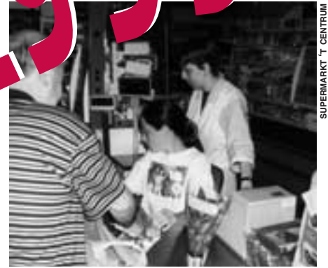
SUPERMARKT 'T CENTRUM