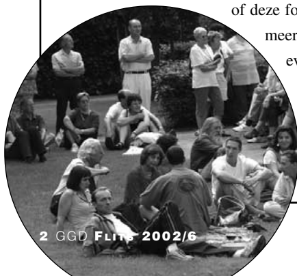
2 GGD FLITS 2002/6

In de Grootste Gemene Deler van september publiceerden wij een fotoreportage van Euro-Zoersel 2002. Veel mensen vragen ons nu of deze foto's te koop zijn en of er nog meer foto's zijn. Wij vroegen dit even na. Inderdaad, de 428 foto's zijn op CD te koop bij de vzw Eurozoersel aan 3,50 euro per CD. Wenst u zo'n CD contacteer dan Jef Joosten, tel. 0477/27.93.11.