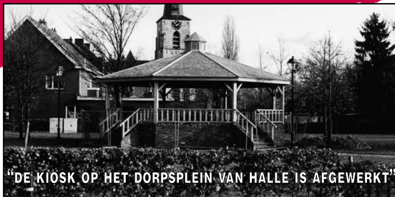
"DE KIOSK OP HET DORPSPLEIN VAN HALLE IS AFGEWERKT"