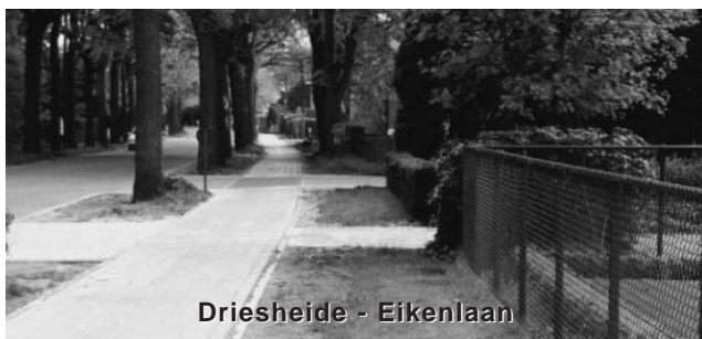
Driesheide - Eikenlaan