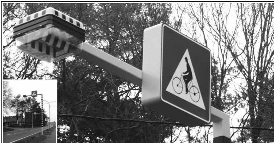
De nieuwe "puntverlichting" op de Sint-Antoniusbaan, ter hoogte van de Hallebaan, zorgt voor een veilige fietsoversteek.