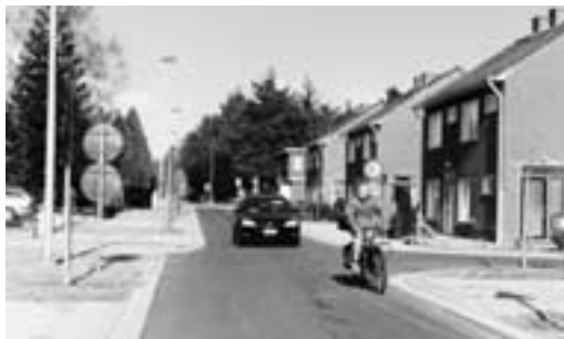
als het verkeer traag moet rijden, is het dikwijls veiliger dat fietsers en auto's samen van de rijweg gebruik maken