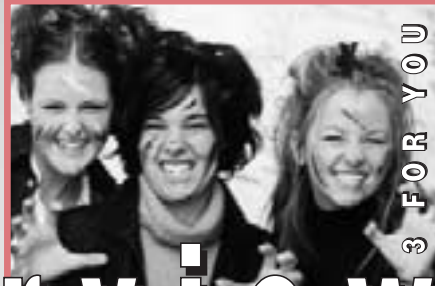
3 FOR YOU