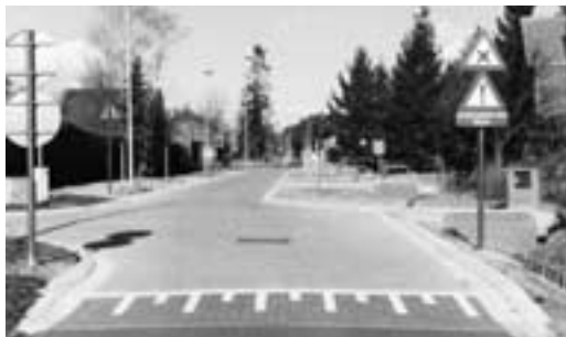
de bewonersgroep koos voor een flinke snelheidsremming in de richting van een zone-30