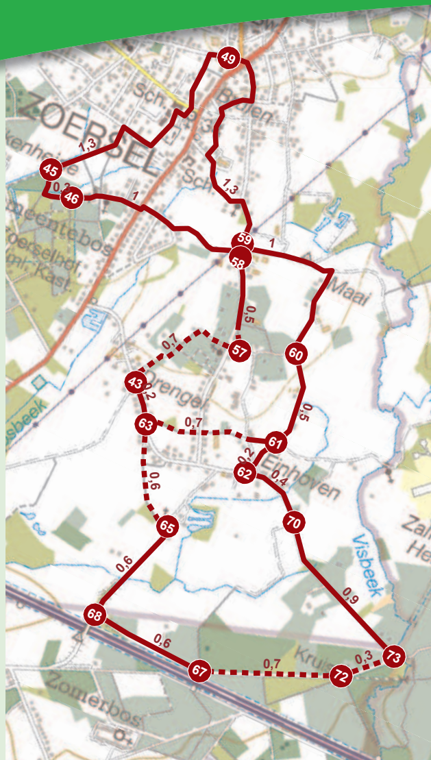
fragment uit de topografische kaart regio Zoersel met toelating van het NGI A2745