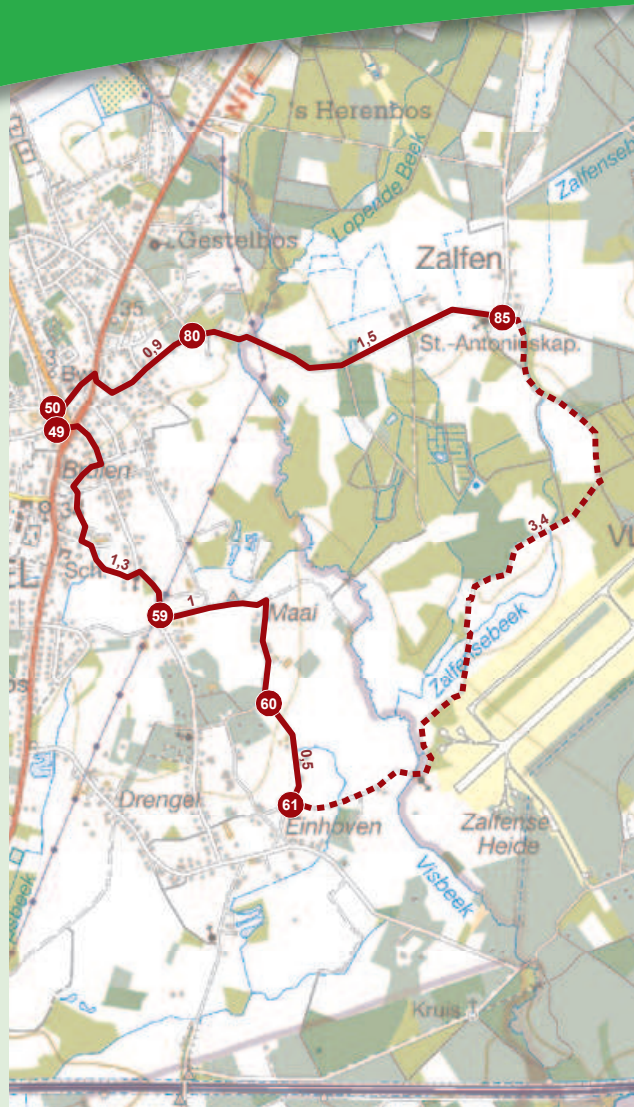
fragment uit de topografische kaart regio Zoersel met toelating van het NGI A2743