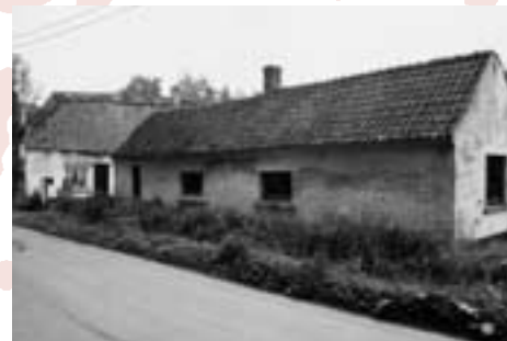
't Wit Poortje op Liefkenshoek, half pannen half stro. Deze oude hoeve werd tijdens de tweede wereldoorlog gebruikt als schuilplaats voor vervolgte Joden.