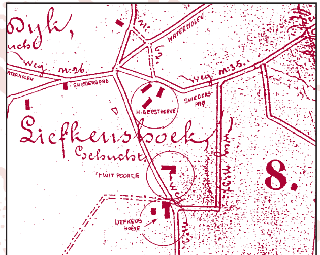
Het gehucht Liefkenshoek rond 1850 met onder andere 3 hoeses : Liefkenshoeve, H. Geesthoeve, Hoeve

Wij zoeken alvast verder in het archief van Herentals. Die versterking was immers een kleine broer van een grote versterking in Herentals.