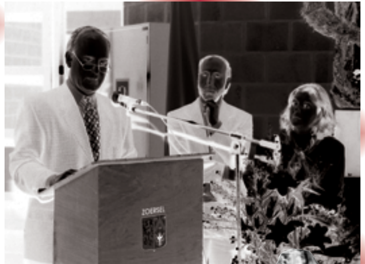
Op 24 januari werd de nieuwe gemeentelijke kleuterschool het "Knagelijntje" in de Mie-Manstraat officieel geopend.

Op 25 januari was het "opendeur", clowns, pret, plezier, verwondering, bewondering, ... het hoort er die dag allemaal bij !