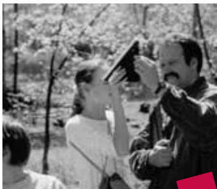
Meester Willi en een leerling vissen uit hoe hoog een boom is. Dit kan ook vanop de grond, zonder er in te klauteren.

tel. 03/380.13.46 fax. 03/380.13.30 kris.ryckaert@zoersel.be